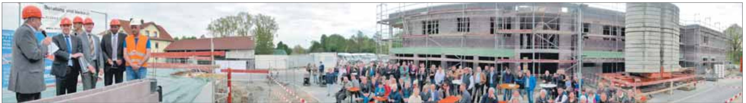
Festakt auf halber Strecke: Bis Dezember soll ein Großteil des neuen Quartiers bezugsfertig sein.